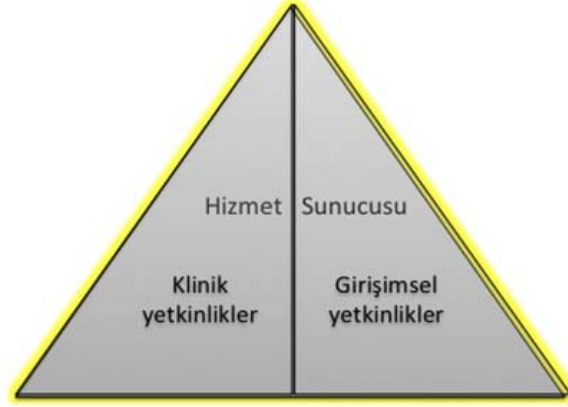
Şekil 2- TUKMOS yedinci temel yetkinlik alanı: Hizmet Sunucusu

Girişimsel Yetkinlik: Bilgiyi, kişisel, sosyal ve/veya metodolojik becerileri tıbbi girişimler konusunda kullanabilme yeteneğidir.